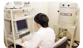
放射能精密測定装置▲