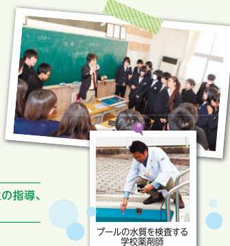
プールの水質を検査する 学校薬剤師

学校薬剤師とは、市町村等から依頼を受け、地域の学校の環境衛生の指導、健康教育指導などをお手伝いしています。