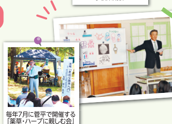
毎年7月に菅平で開催する「薬草・ハーブに親しむ会」

健康づくりのためのさまざまな講習会に、講師として会員薬剤師を派遣しています。「上田市ことぶぎ大学」をはじめ、各地の公民館等、多くの実績があります。随時対応しますので、ご要望がありましたらご連絡ください。