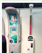
▲身体関連測定機器