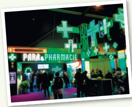
▲ネオンサイン会社の展示