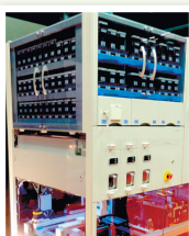
▲薬の一包化の機械

テーマは「Le Futur de la Pharmacie(薬局の未来)」。 出展ブースは100を超え、白衣からネオンサイン、包装機 械など、薬局関係者には興味深い様々な商品が紹介さ れ、商談スペースはとて賑わっていました。