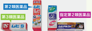
同じブランドの製品でも、成分によって分類が異なります▲

第2類医薬品・・・副作用、相互作用などで安全性上、注意を要するもの。中でも、より注意を要するものは指定第2類医薬品(表示:第2類医薬品)となっています。第2類医薬品には、主にかぜ薬や解熱剤、鎮痛剤など日常生活で必要性の高い製品が多くあります。カウンターの7メートル以内で販売します。