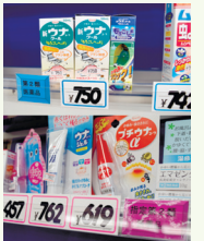
こちらの薬局では、分類ごとにプライスカード▲の色を変えてわかりやすく陳列しています

要指導医薬品・・・OTC 医薬品として初めて市場に登場したものなど、取り扱いに十分な注意が必要なものは、販売の際に薬剤師が提供する情報を聞くとともに、書面による説明が原則です。そのため、インターネット等での販売はできません。店舗でも、薬剤師の説明を聞かないと購入できないよう、簡単には手の届かない場所に陳列することが決められています。