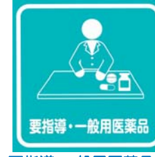
要指導・一般医薬品の取扱い、相談できます