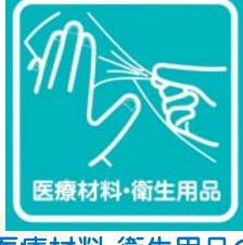
医療材料・衛生用品の取り扱いがあります