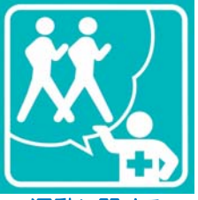
運動に関する健康相談できます

「ピクトグラム」とは、何らかの情報や注意を示すために表示される視覚記号(サイン)の一つ。誰もがパッと見て理解しやすいように単純化したイラストで表されます。上田薬剤師会では、各薬局の取り組み内容を地域の皆さんにわかりやすく発信して薬局を「選んでいただく」一助にするため、その薬局のできること(機能)を全15種類のピクトグラムで表し、ステッカーにして店頭に掲げています。それぞれの内容を説明します。