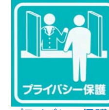
プライバシー保護に配慮しています