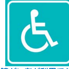
障がい者が利用できる施設です