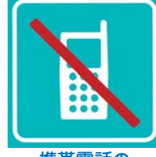
携帯電話の通話使用禁止