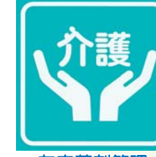
在宅薬剤管理いたします