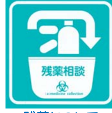
残薬について相談できます