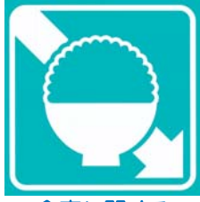
食事に関する健康相談できます