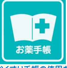
おくすり手帳の使用を推進しています