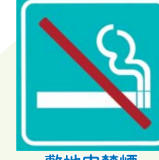
敷地内禁煙・禁煙サポート