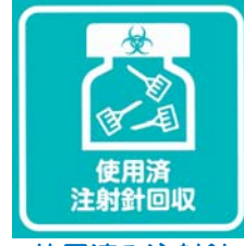
使用済み注射針回収できます