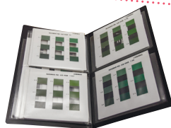
有彩色黒板 明度・彩度判定表